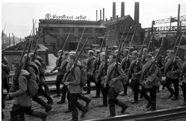
Рис. 1. Ополченцы Кировского завода. Ленинград, 1941 год

Началась всеобщая мобилизация . Только до конца июля было призвано в армию около 5 миллионов человек. Очень многие отправлялись на фронт добровольцами, особенно молодёжь. Одновременно на территориях, которые могли оказаться вблизи районов боевых действий, организовывались народные ополчения . Они рыли окопы, создавали противотанковые заграждения, оборудовали бомбоубежища и т. д.