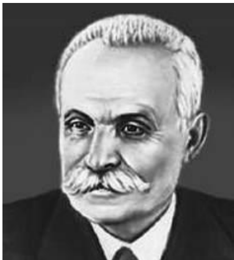
Академик Е.О. Патон. Фотография первой половины XX в.

Колоссальное значение сыграло изобретение и внедрение в производство академиком Е.О. Патоном аппарата автоматической сварки броневых листов, что в несколько раз повысило производительность труда сварщиков в танковой промышленности. Подобное техническое новшество в Соединенных Штатах было создано только в 1944 г., а в Германии до конца войны все сварочные работы на танковых заводах велись вручную.