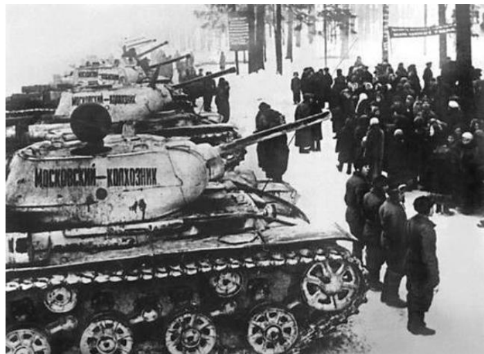
Колонна танков «Московский колхозник». Фотография 1942 г.

Преодолевая все эти и многие другие трудности, рабочие и служащие перебазируемых предприятий вместе с местным населением Поволжья, Урала, Сибири, Казахстана и Средней Азии в сложнейших условиях необычайно суровой первой военной зимы в предельно сжатые сроки разместили и ввели в строй эвакуированное оборудование. Уже к весне 1942 г. основная масса перебазируемых заводов и фабрик работала на новых местах, поставляя фронту разнообразную военную продукцию.